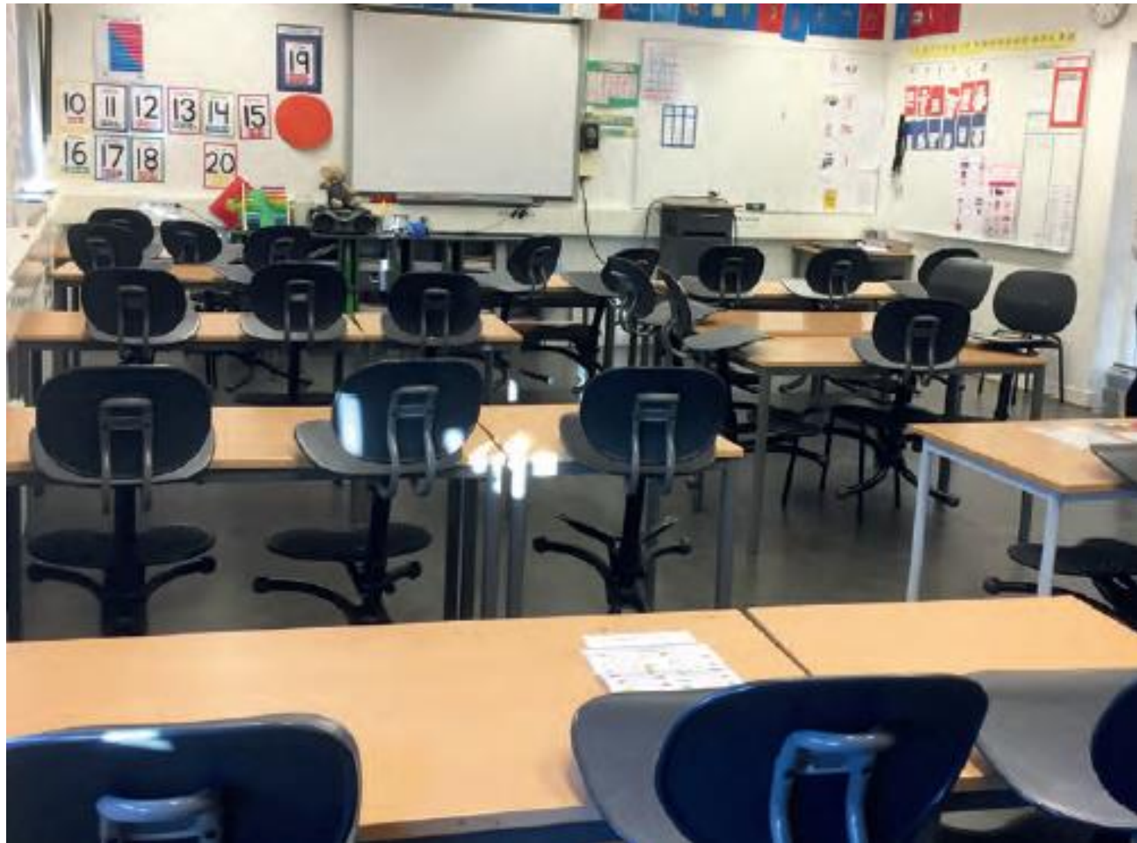
Endre bunntekst via menyen Sett inn -> Topptekst/bunntekst